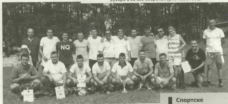
Финалисти турнира у фудбалу

– Сећам се свог првог дана, када нисам имао ни сто и срећан сам и поносан што могу да се похвалим да радим у оваквом руднику, који се ни по чему не