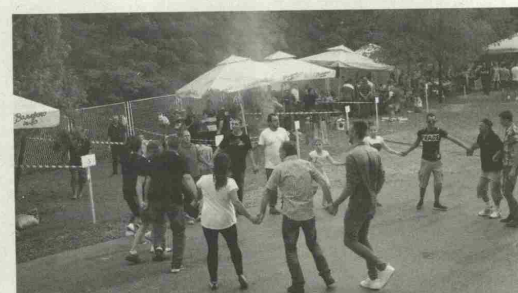
Коло на флотацији

– Било је и лепих тренутака, али било је и тешко. Дешавале су