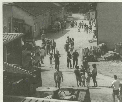
Капије „Рудника“ на овај дан отворене су за чланове породица рудара и за све добронамерне посетиоце