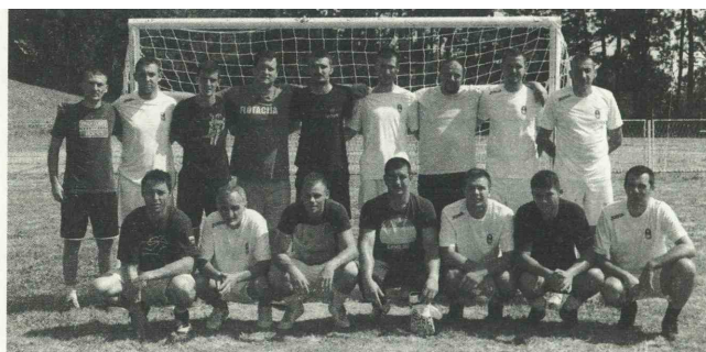
Финалисти турнира у фудбалу