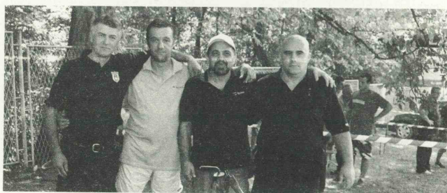
Победничка екипа у спремању гулаша