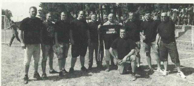
Победничка екипа у надвлачењу конопца