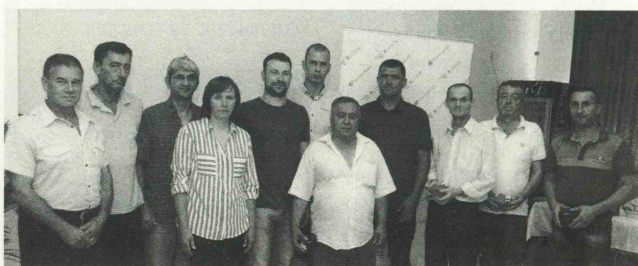
Најбољи рудари у Србији