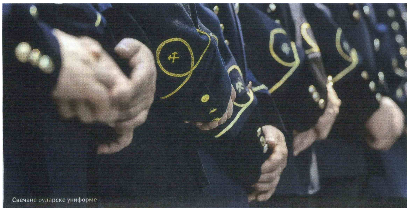
Свечане рударске униформе

На планини Рудник одржана централна прослава Дана рудара Србије. – Просечна плата 55.000 динара, а најбољи копачи зарађују и више од сто хиљада месечно