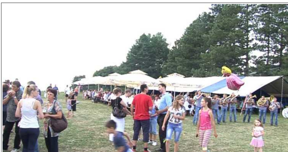
Прослава Дана рудара на Руднику, Фото: Глас западне Србије

Горњи Милановац – Једна од најуспешнијих приватизација у Србији свакако је рудник олова и цинка на планини Рудник,